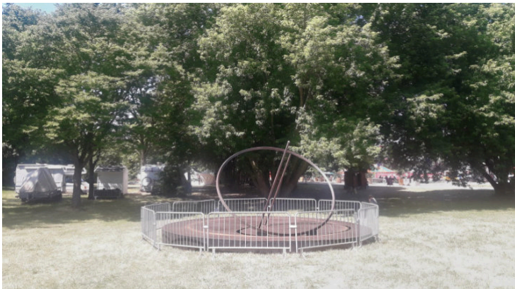
12 barrières Vauban.