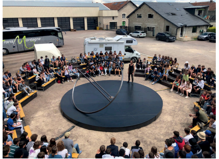
Exemple avec gradins fourni par l'organisateur