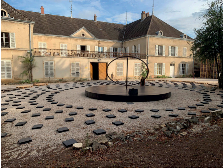
PHOTO DE L'INSTALLATION