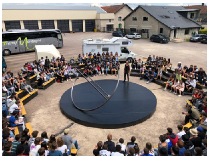
Exemple avec gradins fourni par l'organisateur