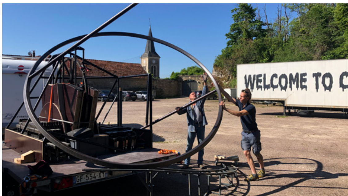
PHOTO DU CHARGEMENT