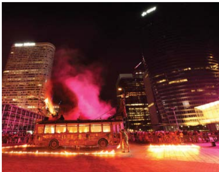
VERSANT - 2018